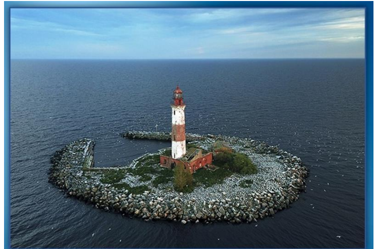
Так выглядит остров Сухо сегодня

Ребята услышали рассказ о том, как небольшой военный гарнизон маленького искусственного острова в Ладожском озере в течение нескольких часов вел бой с хорошо вооруженным и подготовленным фашистским десантом, который поддерживали немецкие военные корабли и